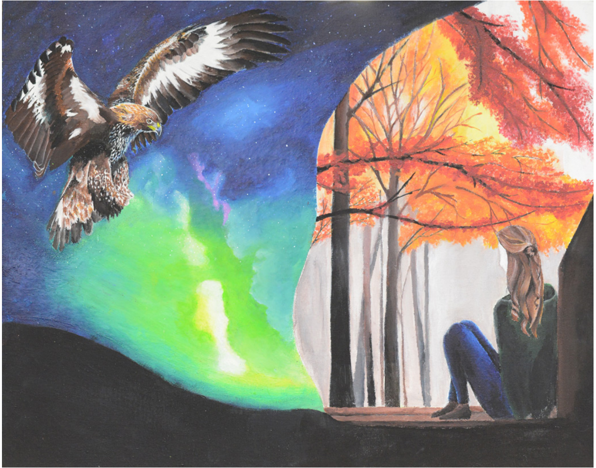
Katharina Aporta, Selbstbildnis, Acryl auf Hartfaser, 2017