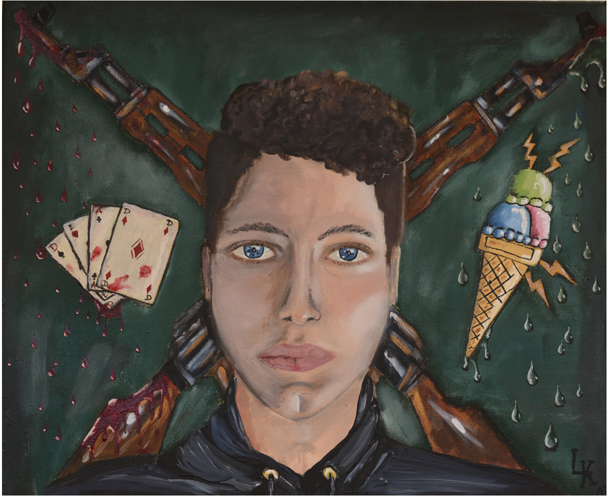
Lennard Kalok, Selbstbildnis, Acryl auf Leinwand, 2017