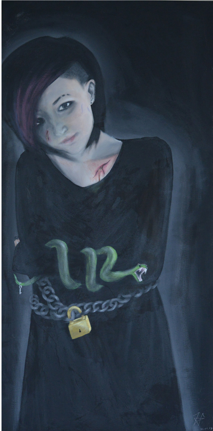
Ohne Name, Selbstbildnis, Acryl auf Leinwand, 2017