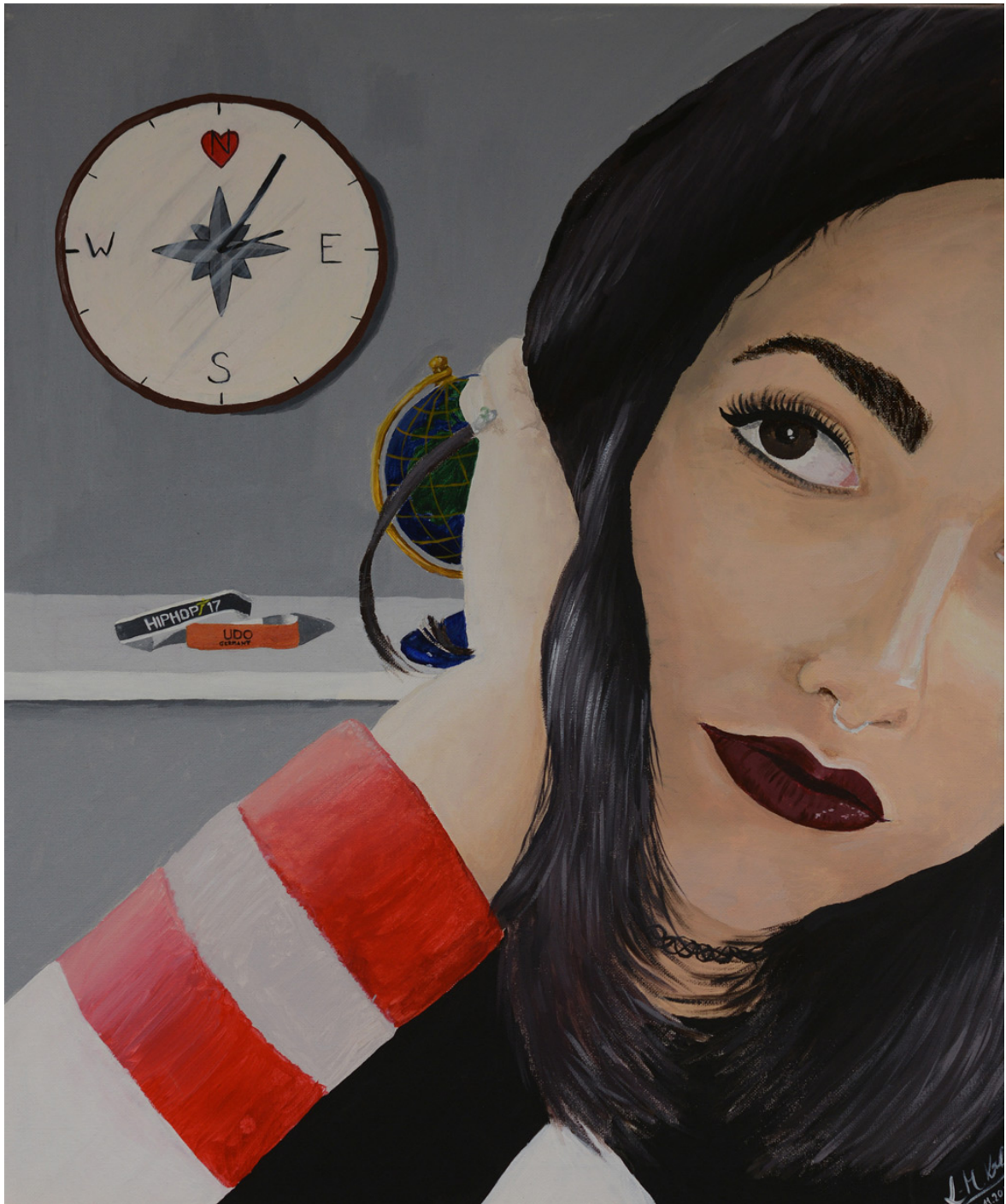
Anna-Maria Kölbl, Selbstbildnis, Acryl auf Leinwand, 2017