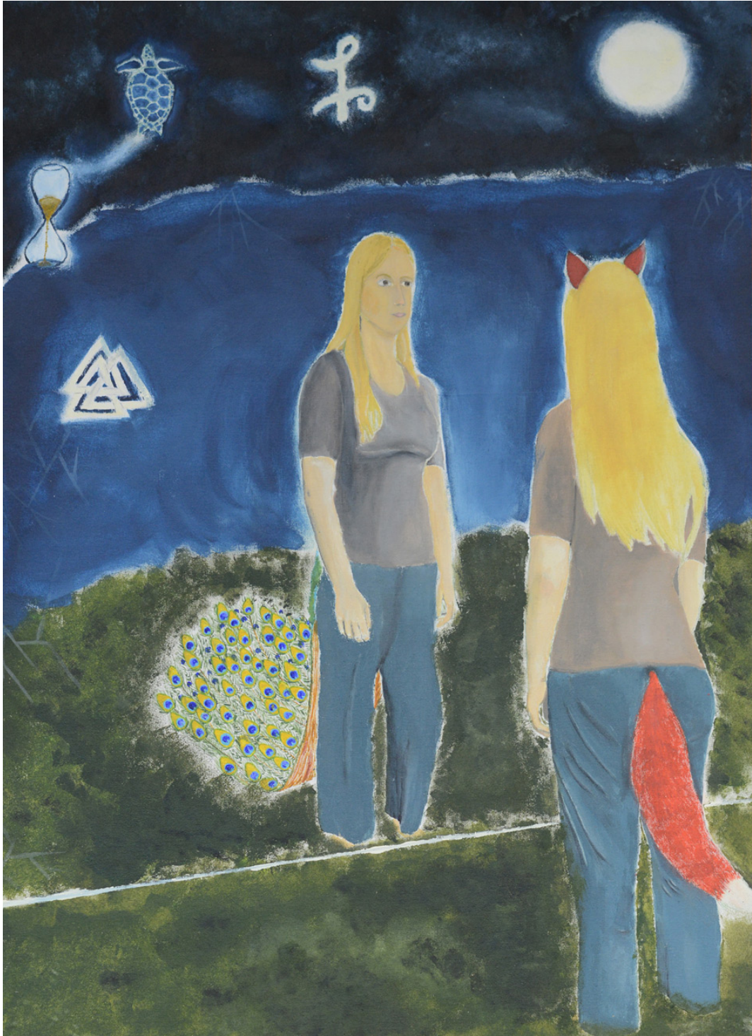
Julia Bertram Selbstbildnis, Acryl auf Hartfaser, 2017