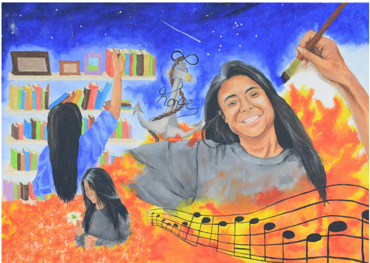
Karen Denise Go Siong, Selbstbildnis, Acryl auf Leinwand, 2017