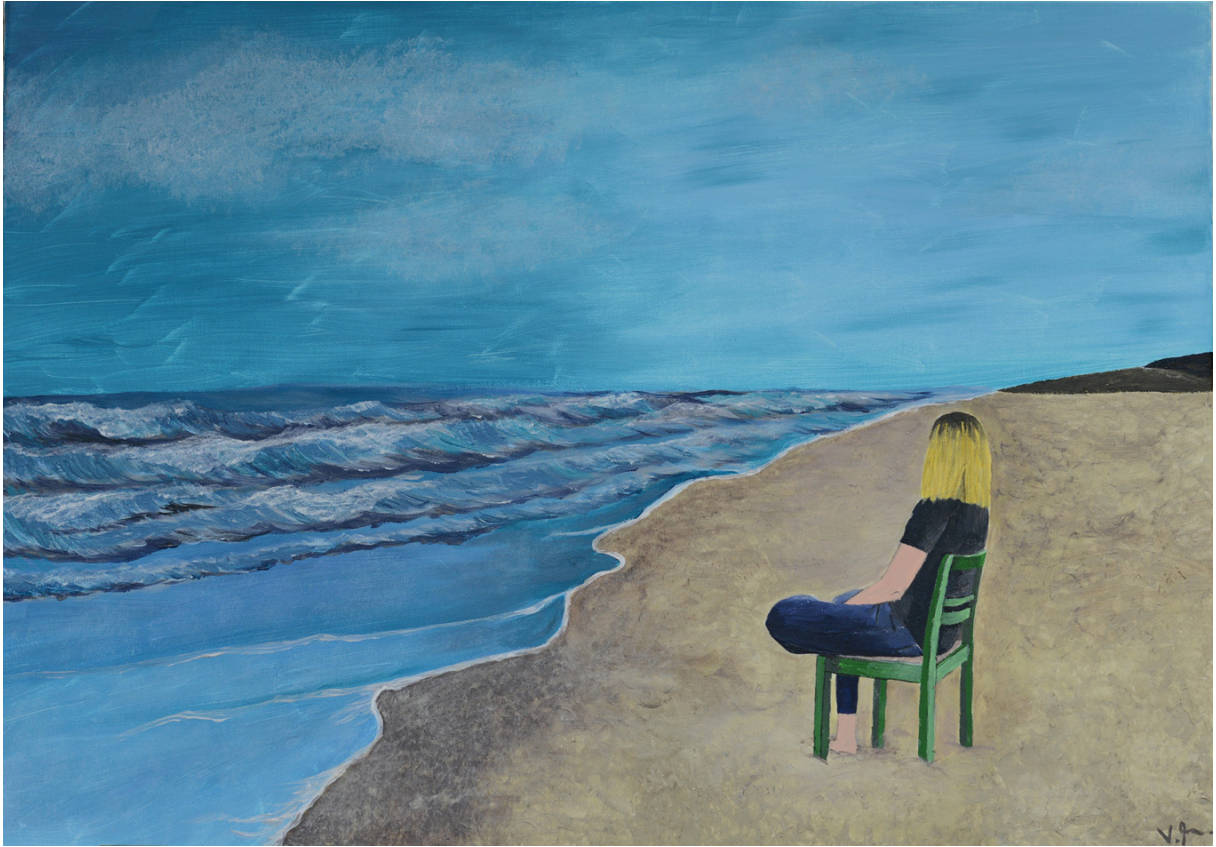
Vicky, Selbstbildnis, Acryl auf Leinwand, 2017