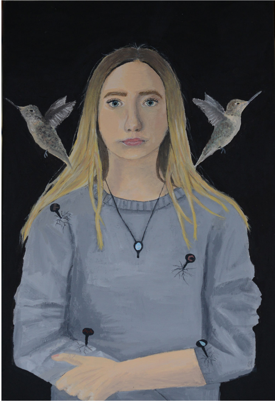
Emily Dombrowski, Selbstbildnis, Acryl auf Leinwand, 2017