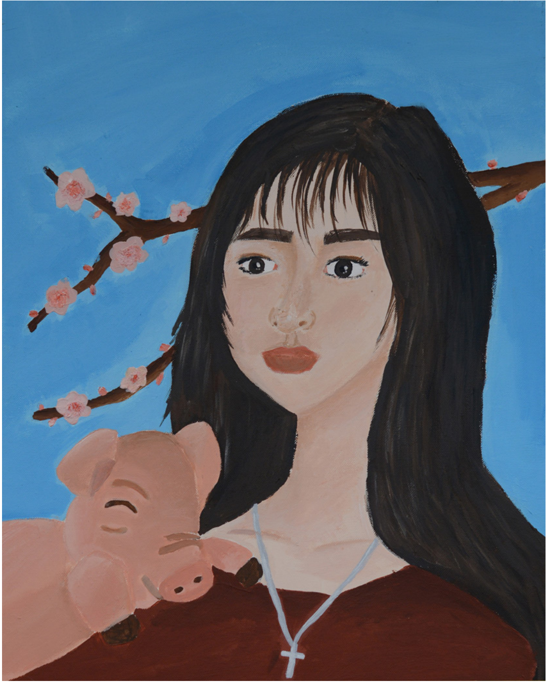
Chae-Eun Shin, Selbstbildnis, Acryl auf Leinwand, 2017