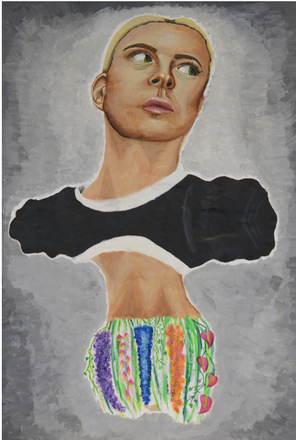
Carolin Foierl, Selbstbildnis, Acryl auf Hartfaser, 2017