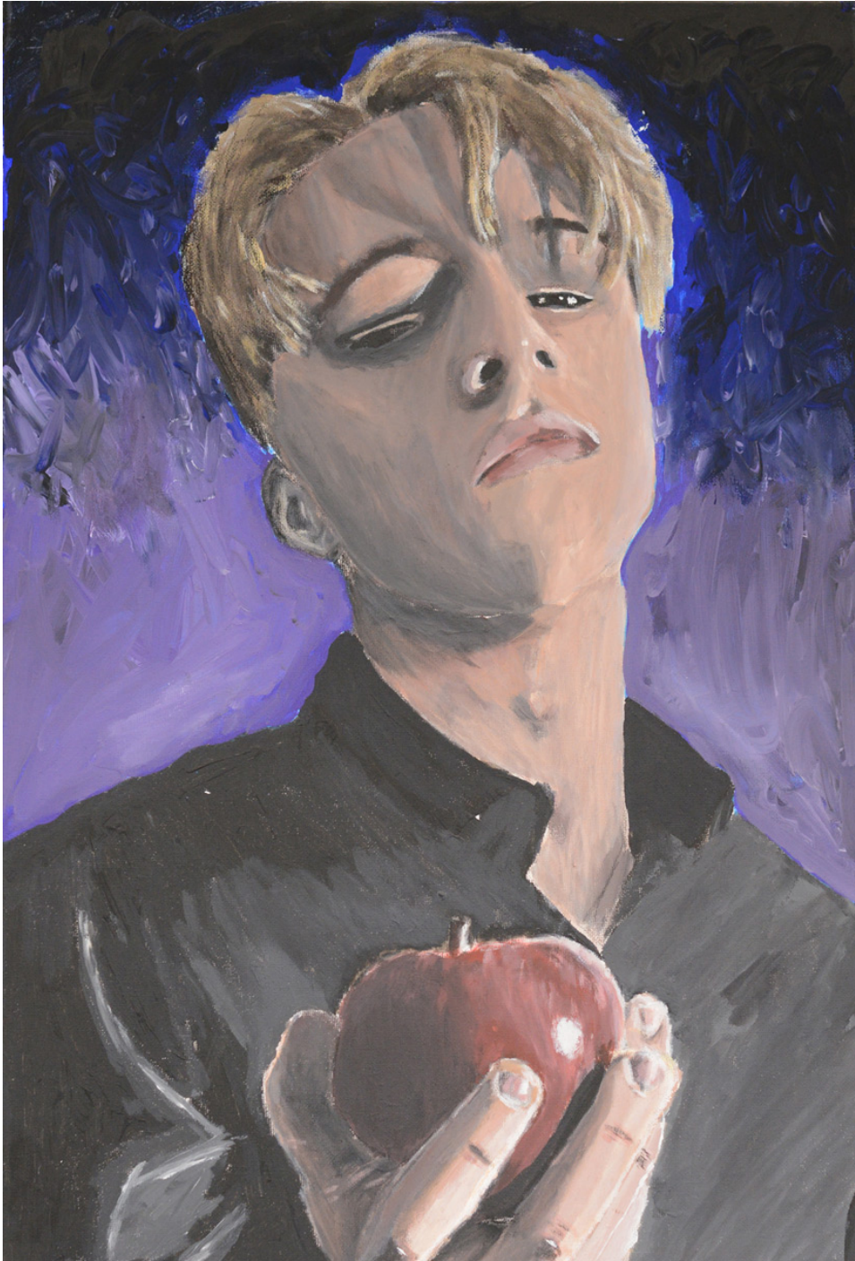
Alen Dedovic, Selbstbildnis, Acryl auf Leinwand, 2017