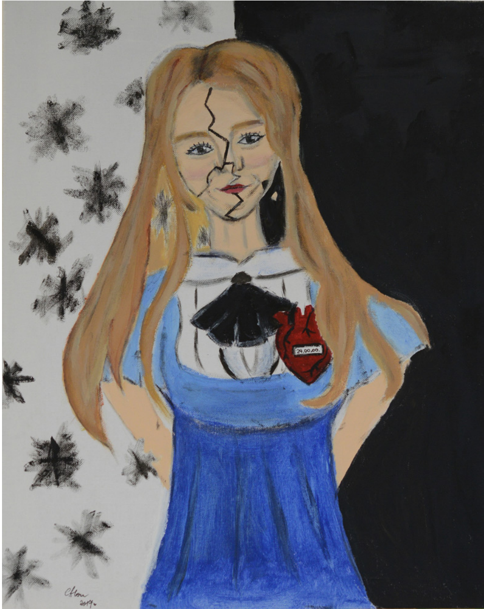
Xin Yan Hou, Selbstbildnis, Acryl auf Leinwand, 2017