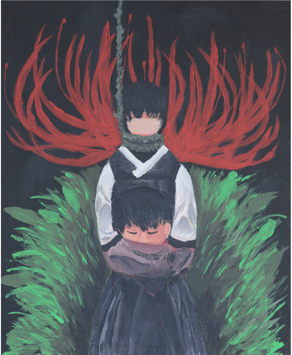
Haekang Lee, Selbstbildnis, Acryl auf Hartfaser, 2017