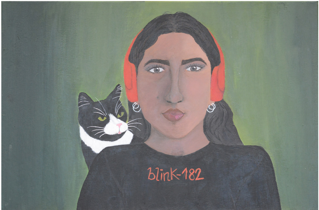
Anna Ghezelbash, Selbstbildnis, Acryl auf Leinwand, 2017