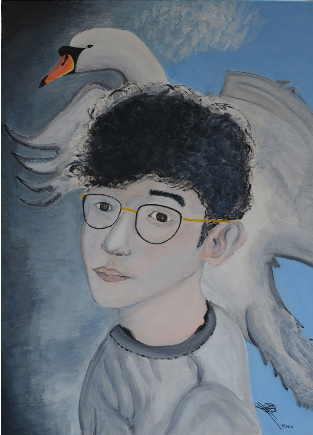
Nae-Guhn Yi, Selbstbildnis, Acryl auf Leinwand, 2017